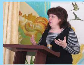
Семинар Консула для пытливой николаевской аудитории